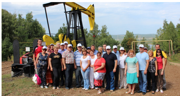
Выездное заседание совета

видам спорта, а также принимает участие в Спартакиаде, проводимой Федерацией профсоюзов Самарской области, где уже в течение 6 лет является победителем общекомандного зачета.