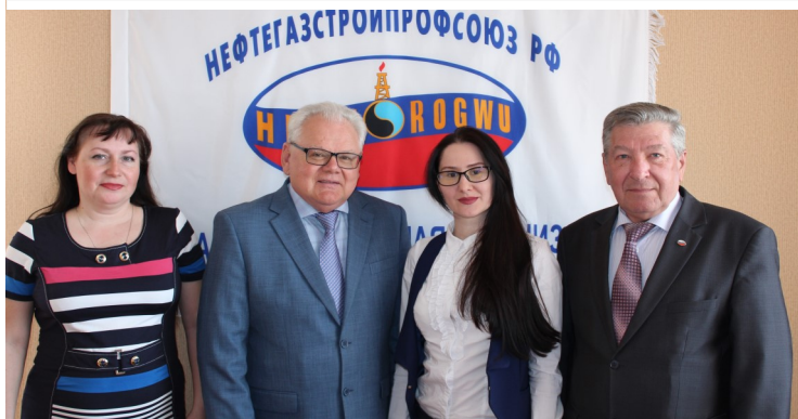
Аппарат Самарской областной организации Профсоюза

помощь по юридическим и организационным вопросам рядовым членам профсоюза, при необходимости представляя их интересы в административных и судебных органах. Регулярно организуется обучение профактива и уполномоченных по охране труда.